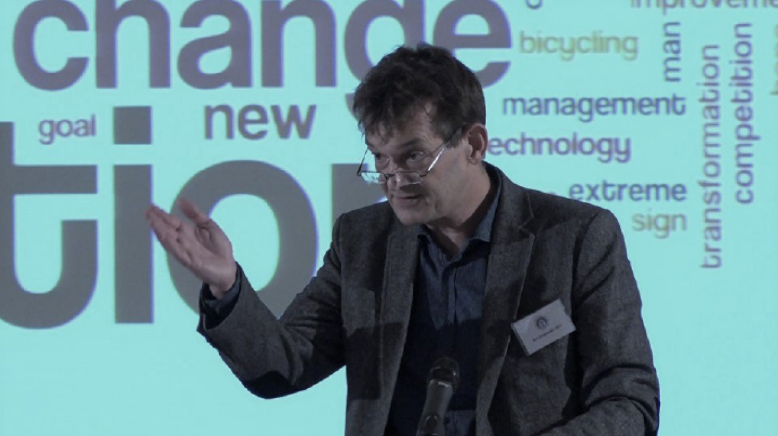
Konferenční dny Sociální práce na obci (duben 2018)