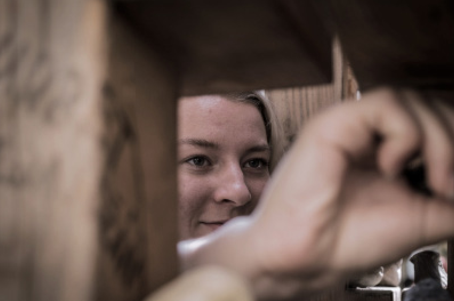
Poslední vkládání kamenů do Sochy příběhů (květen 2018)