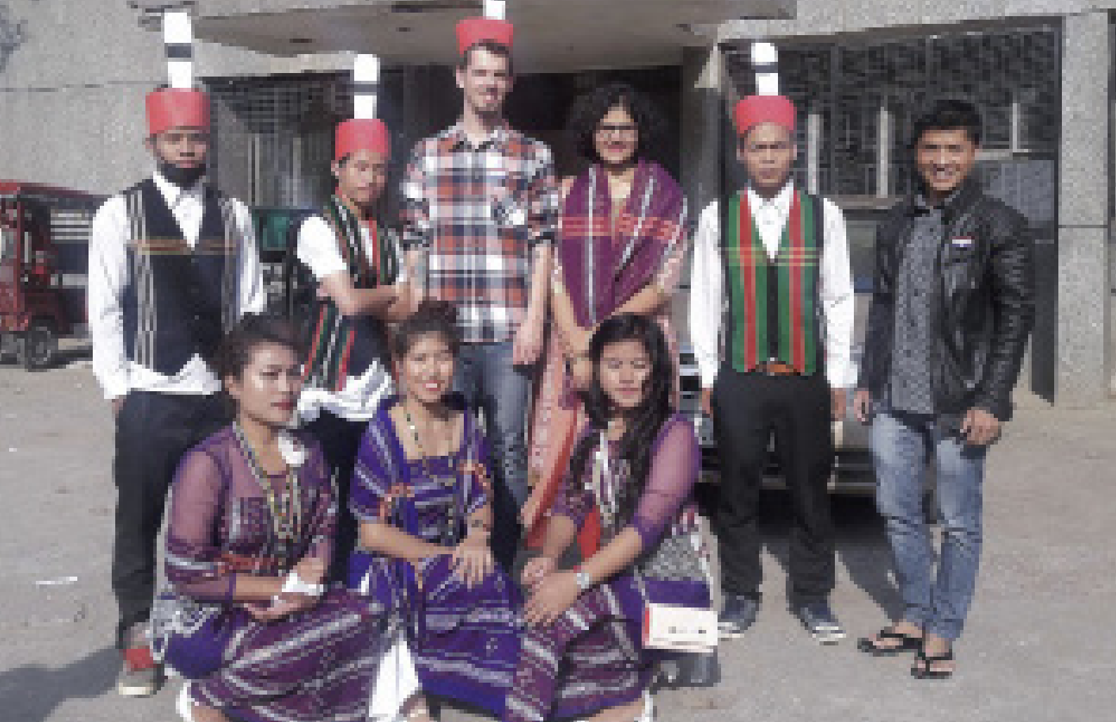
Zahraníční odborná praxe (SOHUP)