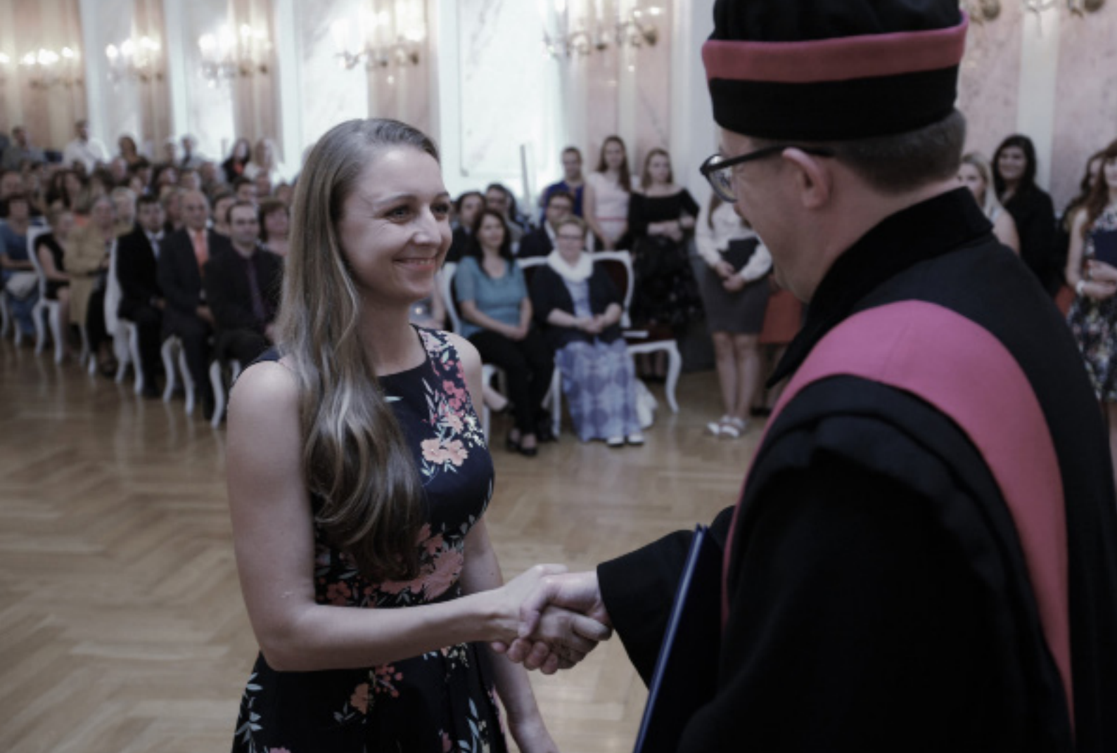
Promoce, Arcibiskupský palác (červen 2018)