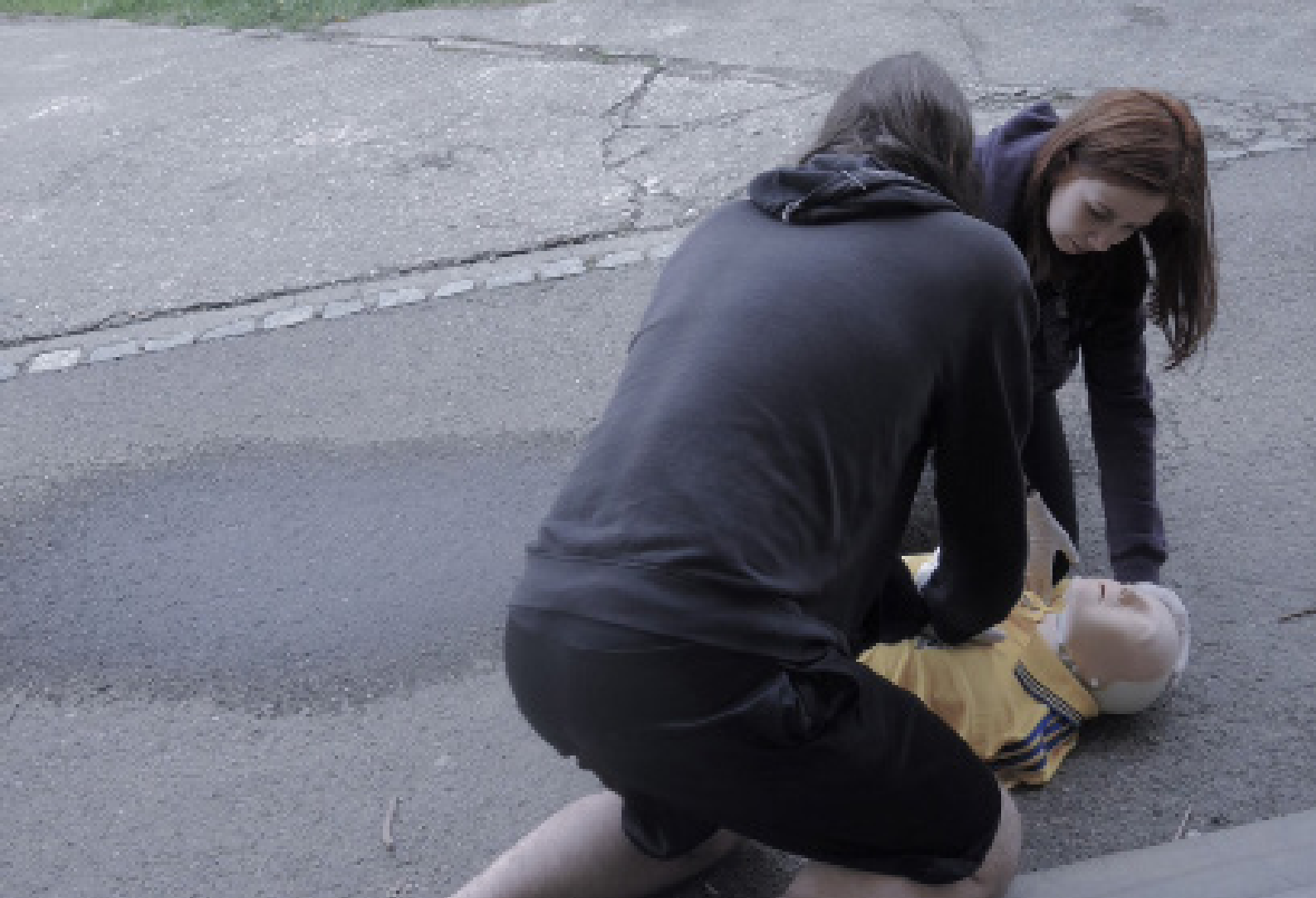
Studijní soustředění, Vizovice (duben 2018)